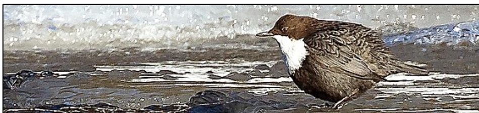
Figur 1. Fossekall om vinteren (Fotograf Per Pedersen). Hentet fra www.ppedersen.no . Gjengitt med tillatelse.