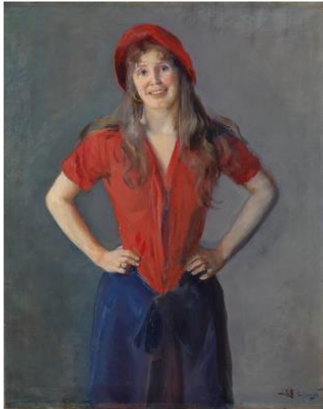
Christian Krohg: Malerinnen Oda Krohg (1888)